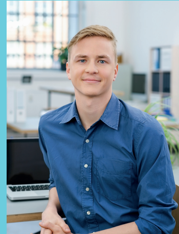
Herausgeber: BGA - Bundesverband Großhandel, Außenhandel, Dienstleistungen e.V.